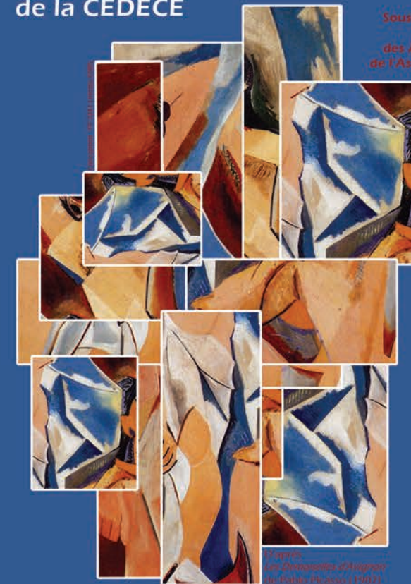
Les Femmes d'Alger de Pablo Picasso (1907)